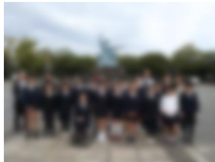
【平和公園（平和祈念像）】

この修学旅行は、すてきな旅となりました。そうなのは、6年生のすてきなところが随所に見られたからです。移動する時に声をかけあって道を空けたり、何かをしてもらった時に「ありがとうございます」の言葉が自然と出たりするなど、周囲の方に嫌な思いをさせていることがほとんどありませんでした。また、6年生どうしの言葉かけは本当にやさしく、一緒に過ごしていて気持ちよいものでした。そして、平和集会での誓いの言葉、それから、みんなで歌った「クスノキ」もすてきでした。6年生の平和への思いや願いが込もっていて、私たちや追悼空間におられた方々の心に響き伝わるものでした。